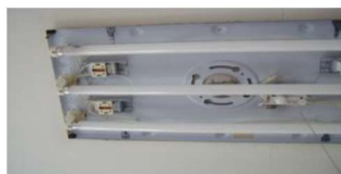
グロー放電管が付いた蛍光灯

学校、病院、デパート、ホテル、映画館などの公共施設では火災報知器を取り付けるように義務付けられています。この火災報知器には煙感知器が接続されており、煙感知器には放射性同位元素アメリシウム241が使われています。アメリシウム241から出るアルファ線により一定の電流が流れています。この中に煙が流れ込むと、煙により電離電流が減少するので、煙の発生を知ることができます。