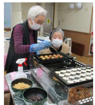
東京ケーキ できあがり。