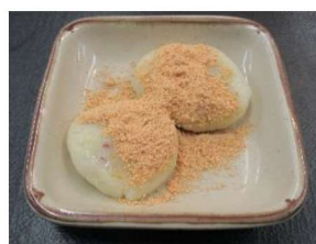
さつまいも団子 おいしかったそうです。