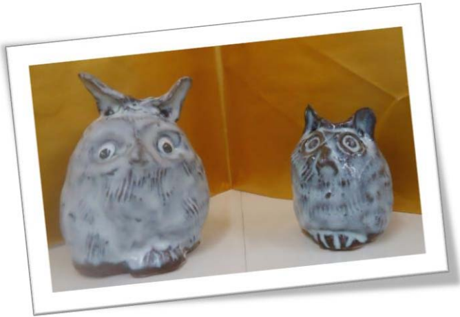
「ふくろう」作) 中西經之・中西美結