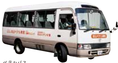
ベテルバス (病院専用無料送迎バス)